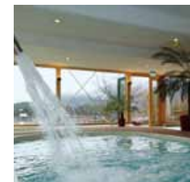
spa highlights 01/2016

säulenmassage dienen nicht nur der Entspannung sondern auch der Gesundheit. Massagen helfen auf wohltuende Weise dem gesamten Körper. Straffende, ausleitende oder entspannende Körper-Treatments verleihen der Körperhaut neuen Glanz. Bei einem Baderitual, auch zu zweit, vergisst der Gast den Alltagsstress. Seifenbürstung und Körperpeeling befreien die Haut vom „Wüstenstaub des Alltags“. Auf natürliche Weise wird die Haut straffer und durch den Stressabbau verbessern sich Ausdruck und Mimik. Mit weiteren pflegenden und reinigenden Gesichtsbearbeitungen erstrahlt das Gesicht in neuer Frische. Welch angenehme Begleiterscheinung, wenn ein Urlaub nicht nur der inneren Erholung sondern auch der Gesundheit und Schönheit zugute kommt. So wird ein Aufenthalt im Romantik Alpenhotel Waxenstein zu einer Auszeit der besonderen Art – Spürbar voller Lebenskraft!