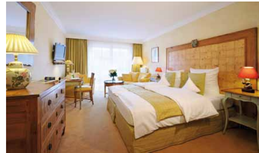
Französische Charme verbunden mit bayerischer Gemütlichkeit zeichnen die geräumigen Gästezimmer und Suiten aus

begibt man sich in professionelle Hände. Die natürlichen Inhaltsstoffe der Naturkosmetik von Primavera und alpinne spricht den Menschen in seiner Ganzheit an, die Sinne werden berührt, Muskeln entspannt und die Haut auf natürlichste und hocheffiziente Weise gepflegt. Eine einzigartige Welt aus ätherischen Essenzen, die die natürliche Schönheit unterstreichen, eröffnet sich dem Gast – ein besonderer Augenblick des absoluten Wohlbefindens. Aromaölmassage, Fußreflex-Harmonisierung, Wirbel-